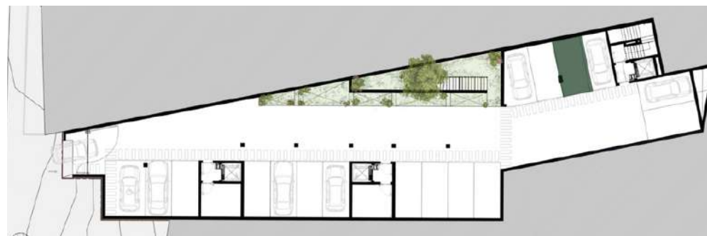
LUGAR DE GARAGEM n.º 13