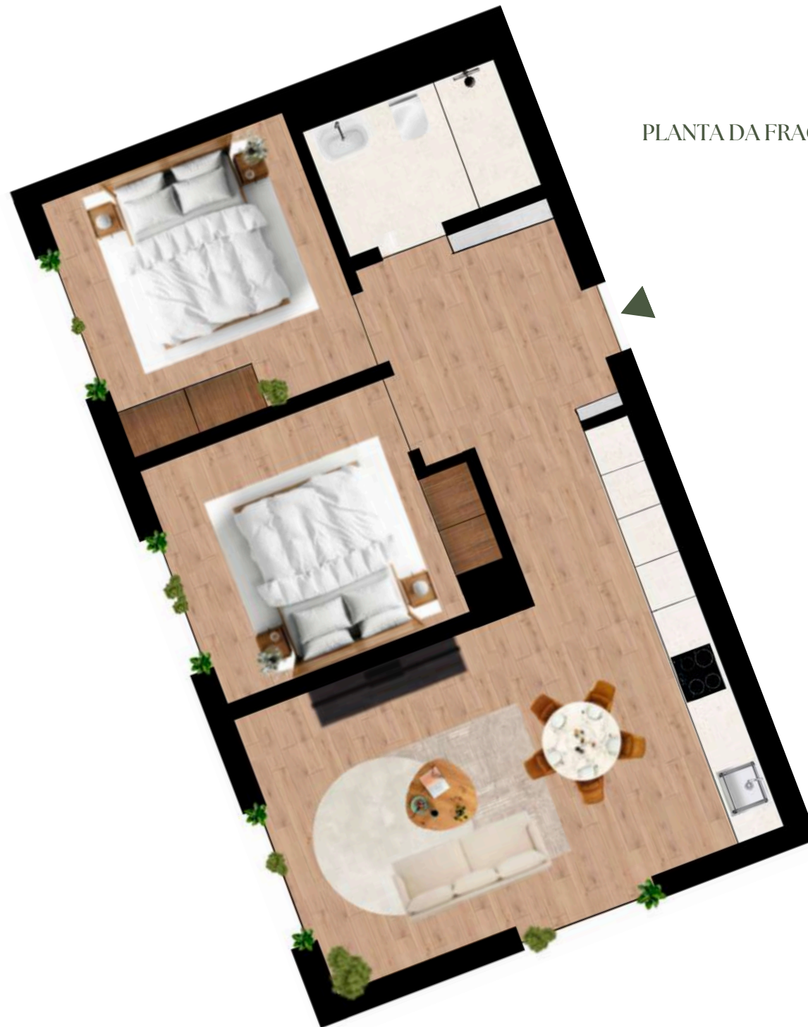
PLANTA DA FRAÇÃO