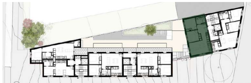
LOCALIZAÇÃO: PISO 2