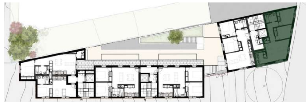
LOCALIZAÇÃO: PISO 3