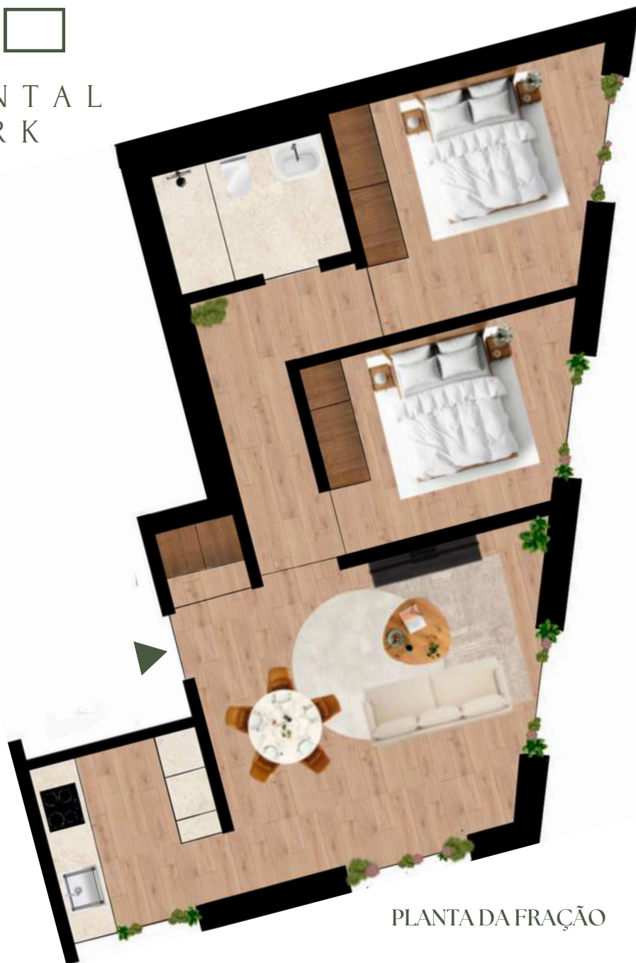
PLANTA DA FRAÇÃO