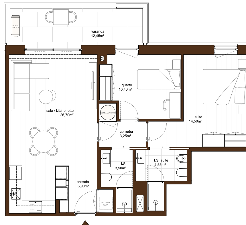
ESQUEMA PISOS 2, 4, 6 (1º, 3º, 5º andar)