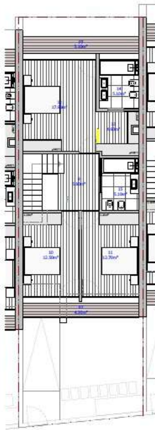
PLANTA DO PISO 2 escala 1/100