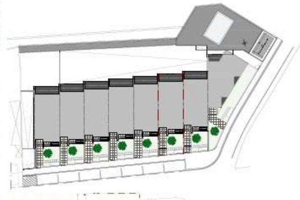
PLANTA DE IMPLANTAÇÃO escala 1/500