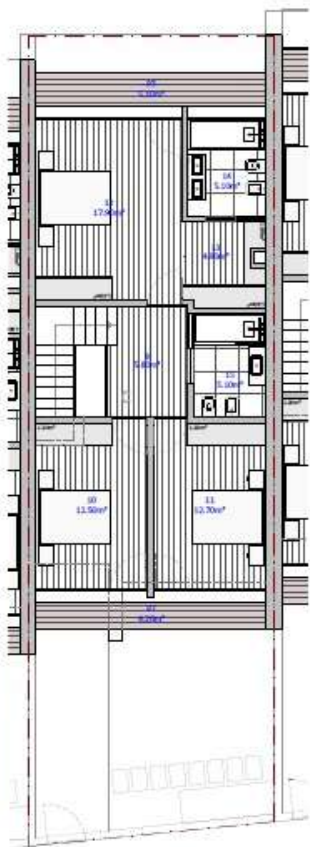
PLANTA DO PISO 2 escala: 1/300