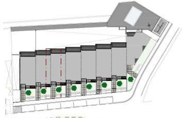
PLANTA DE IMPLANTAÇÃO escala: 1/500