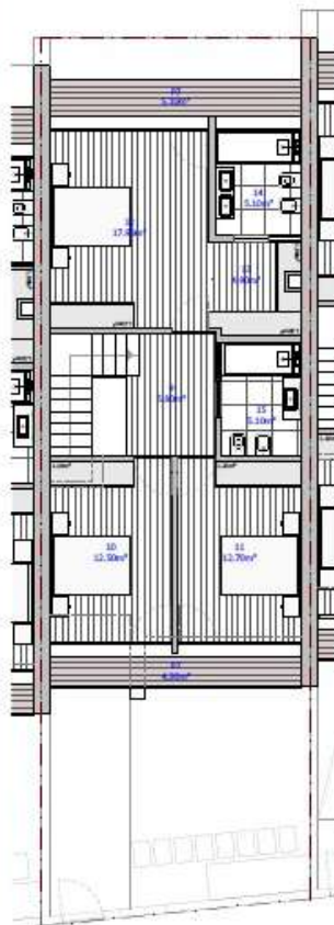
PLANTA DO PISO 2 escala: 1/50