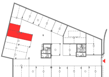
PISO -1 (GARAGEM)

Notas: A área bruta da fracção, corresponde à superfície total do fogo, medida pelo extradorso das paredes e eixos das paredes de separação dos fogos, excluindo-se as áreas de terraços e /ou varandas A área útil corresponde ao perímetro de cada compartimento identificado, incluindo as áreas ocupadas por mobiliário e equipamento fixo. A área total afecta a cada fracção poderá ser alvo de correcções, aquando submissão do edifício ao regime da propriedade Horizontal. A informação que consta dos desenhos, poderá ser alvo de revisão por razões técnicas ou comerciais.