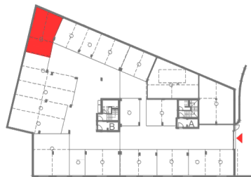
PISO -1 (GARAGEM)

Notas: A área bruta da fracção, corresponde à superfície total do fogo, medida pelo extradorso das paredes e eixos das paredes de separação dos fogos, excluindo-se as áreas de terraços e /ou varandas