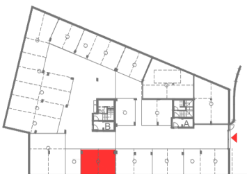
PISO -1 (GARAGEM)

Notas: A área bruta da fracção, corresponde à superfície total do fogo, medida pelo extradorso das paredes e eixos das paredes de separação dos fogos, excluindo-se as áreas de terraços e /ou varandas A área útil corresponde ao perímetro de cada compartimento identificado, incluindo as áreas ocupadas por mobiliário e equipamento fixo. A área total afecta a cada fracção poderá ser alvo de correcções, aquando submissão do edifício ao regime da propriedade Horizontal. A informação que consta dos desenhos, poderá ser alvo de revisão por razões técnicas ou comerciais.