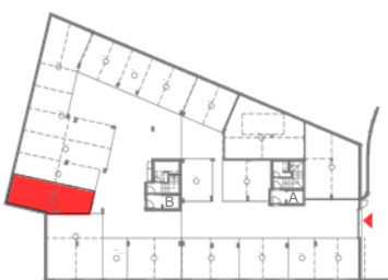
PISO -1 (GARAGEM)